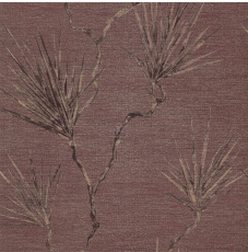
ANTHOLOGY 01 PENINSULA PALM 110820