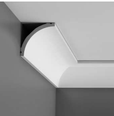
ORAC, ORAC FLEX C240 stropní lišta