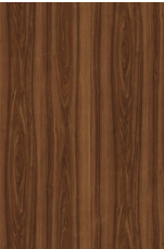
KRONOSPAN, WALNUT 0729 BS