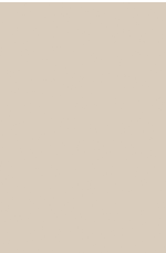
KRONOSPAN, SATIN 7045

Stávající podlaha v části tanečního parketu bude zachována. Bude provedeno nové spojení přechodovou lištou v úrovni podlah s nově pokládaným kobercem.