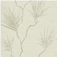
ANTHOLOGY 01 PENINSULA PALM 110821