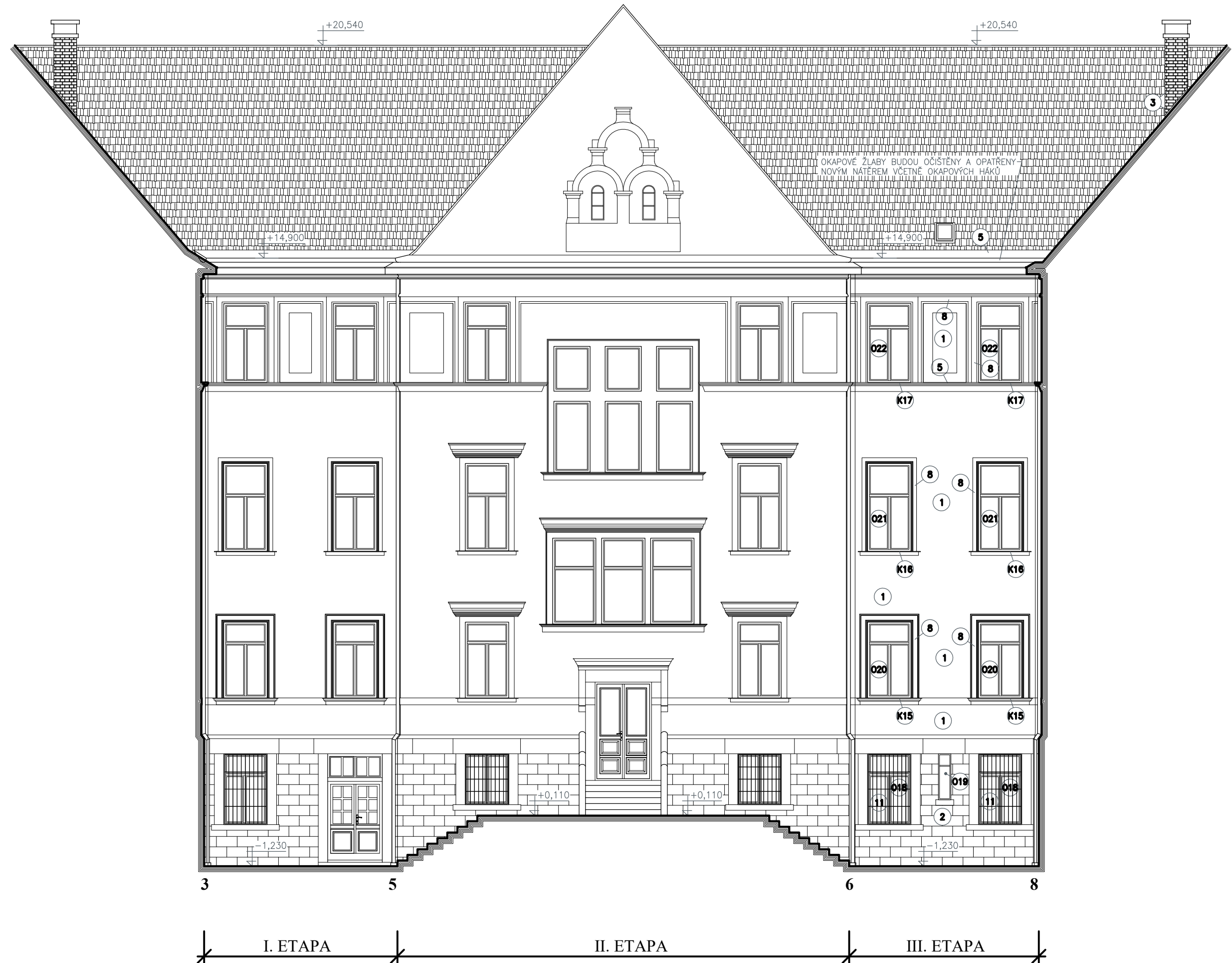
POHLED ZÁPADNÍ ZE DVORA 1